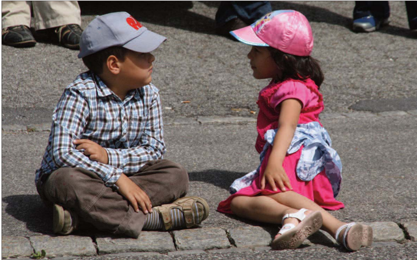
Diese beiden Kids interessieren sich wohl noch nicht so für Marschmusik