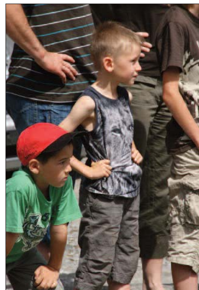
Nachwuchs von Morgen