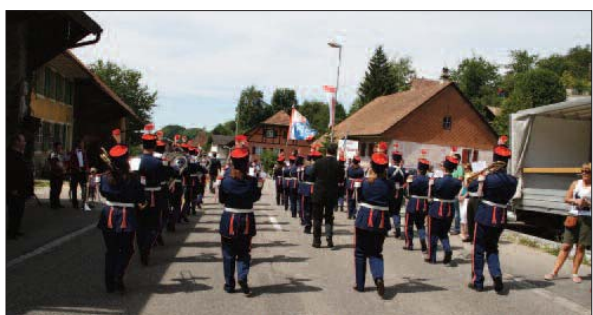
Die Konkordia Balsthal wusste auch von Hinten zu gefallen