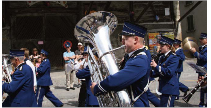
Defilée der Eintracht Holderbank