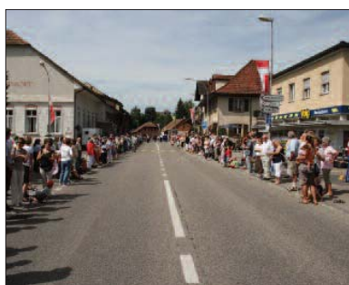
Grosser Zuschaufarmarsch auf der Hauptstrasse