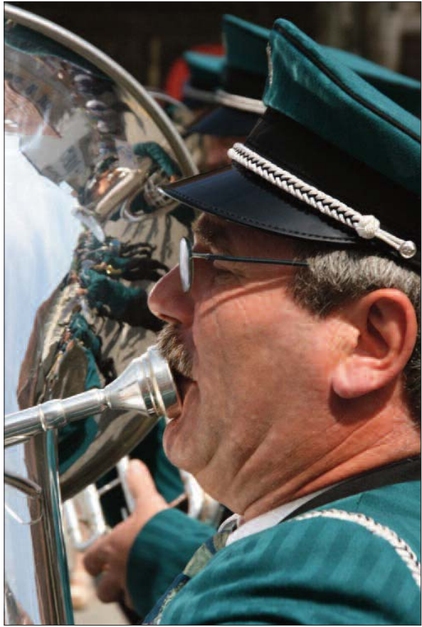
Bläser der Frohsinn Neuendorf