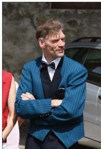
Beobachtet seine Mitstreiter