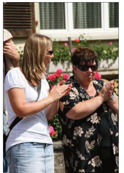
Applaus auf offener Szene